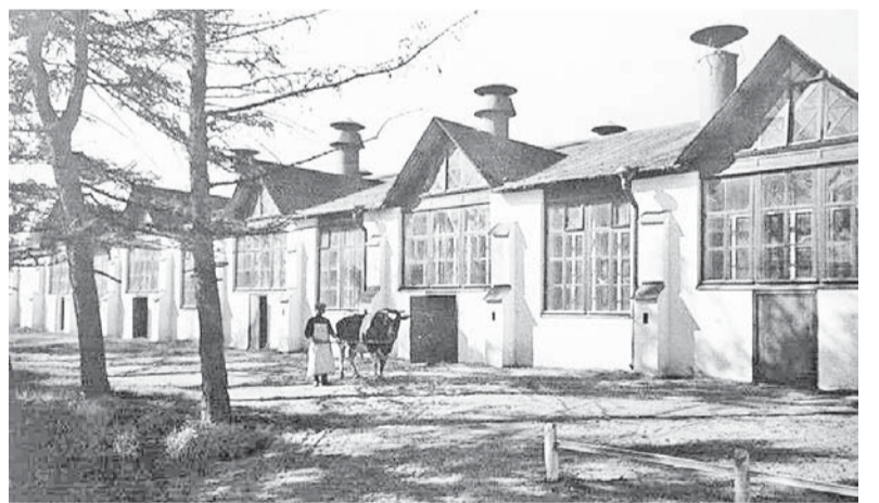
Ферма Бенуа в 1910-е годы