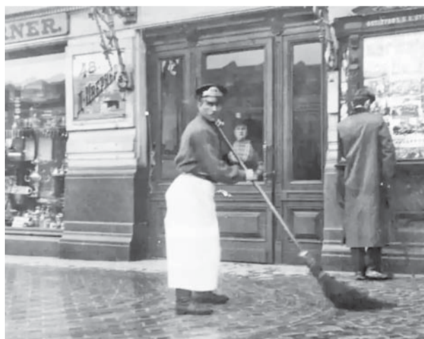
Дворник на Невском проспекте. 1910-е годы