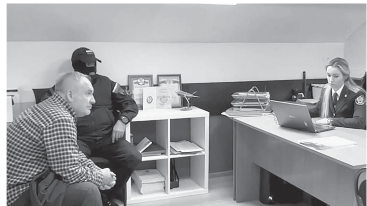
ПРОЕКТ «НИ ДАТЬ, НИ ВЗЯТЬ» РЕАЛИЗОВАН НА СРЕДСТВА ГРАНТА САНКТ-ПЕТЕРБУРГА

В доме 70-летнего служителя права провели обыск, нашли телефоны, около 20 миллионов рублей и иные вещдоки, важные для следствия.