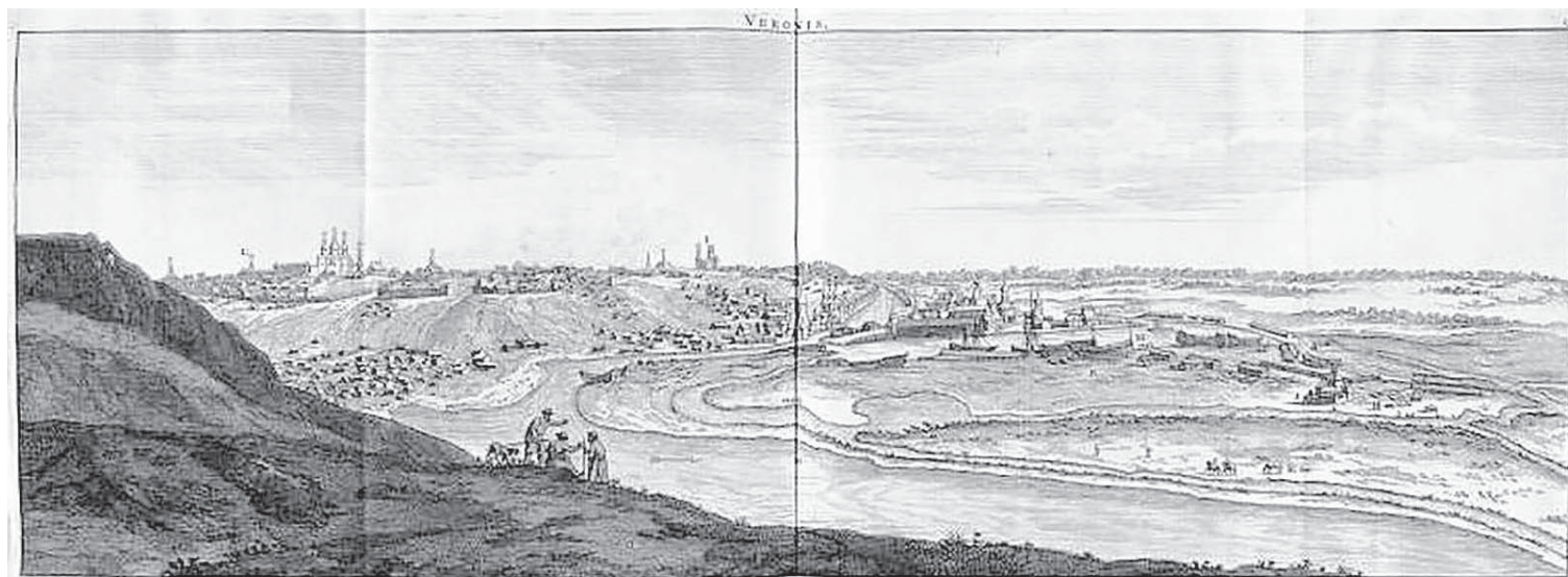
Корнелий де Бруин. Вид на Воронеж. 1703 год