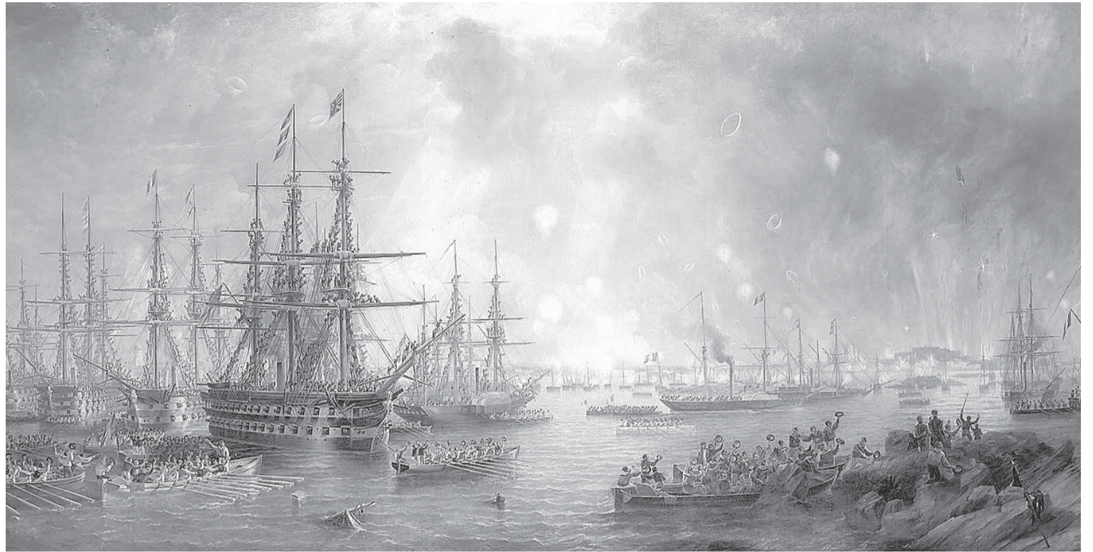
Крымская война. Бомбардировка Свеаборга 9 августа 1855 года. Художник Джон Кармайкл

Солдат истязали, учили совсем ненужным и нелепым приемам и готовили к парадом и смотрам, а не к войне. А кроме того, армию систематически обворовыва-