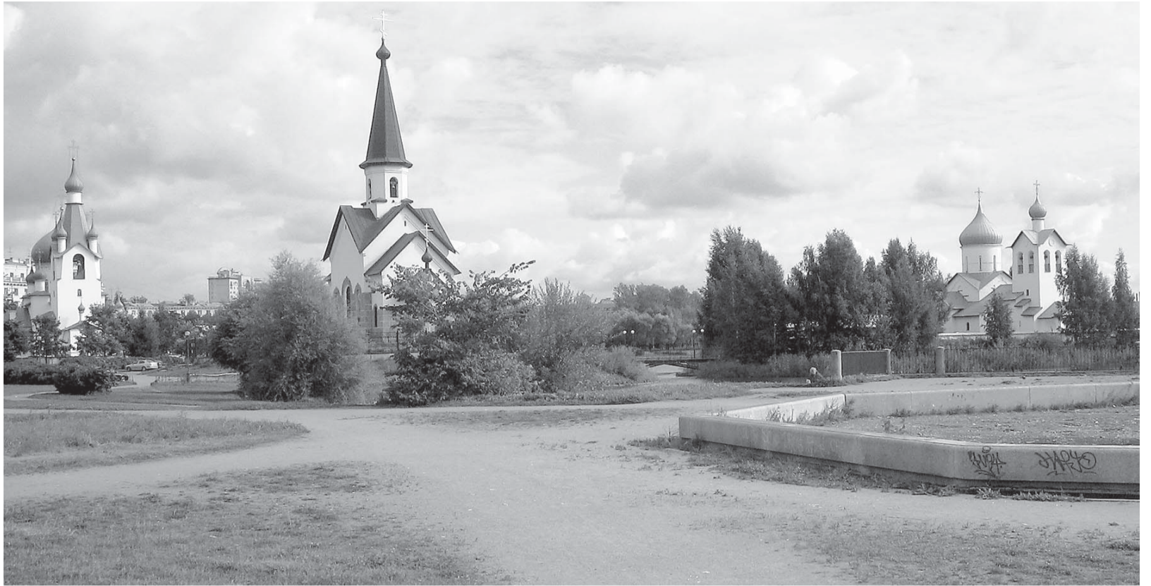
Пулковский парк станет парком Городов-Героев

Также одобрено присвоение Центру содействия семейному воспитанию № 4 Выборгского