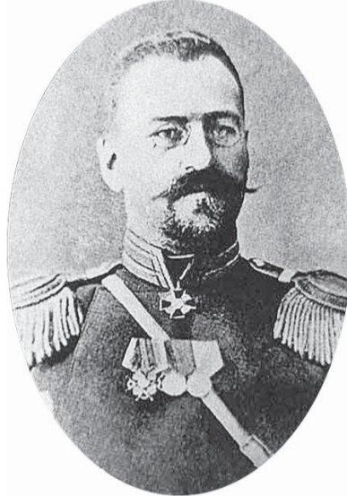
Портрет А. Рейнбота.

Самым известным стало покушение 29 октября 1906 года. В тот день Рейнбот отправился пешком и без охраны (лишь в сопровождении своего помощни-