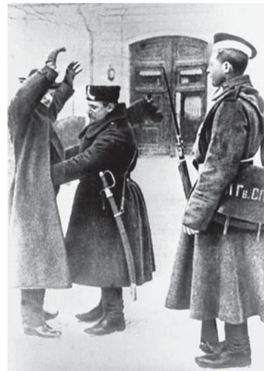
Городовой и солдат обыскивают прохожего