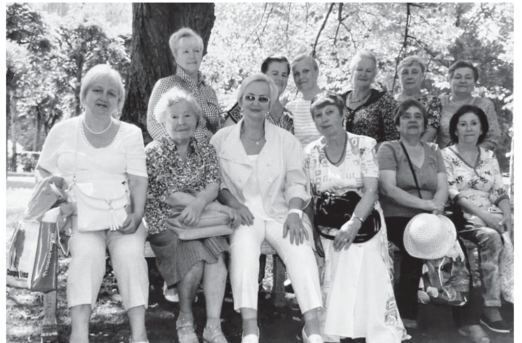
Встреча выпускников 1956 года школы № 400. Павловск, 2019 год

— Родители прожили всю жизнь вместе. Отцу было за 60, когда его не стало, я уже училась в пединституте, мама умерла на 91-м году. Сейчас уже, к сожалению, все мои пять братьев тоже ушли из жизни. Почти все они — кадровые военные. Наше детство совсем не было окрашено в радужные тона, а мне пришлось рано